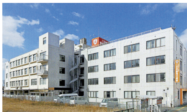
社会医療法人喜悦会 二日市那珂川病院 (50床)