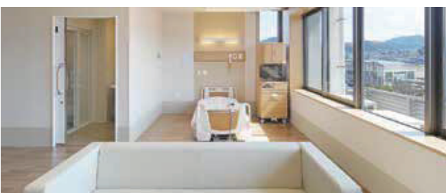
ちくし那珂川病院 病室特1B