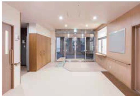
玄関エントランス