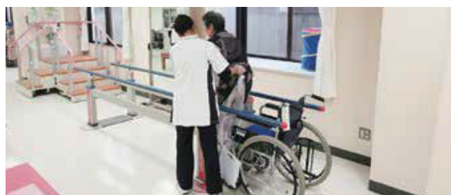
二日市那珂川病院 リハビリ風景