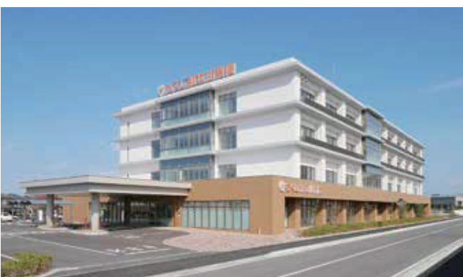
社会医療法人喜悦会 ちくし那珂川病院 (99床)