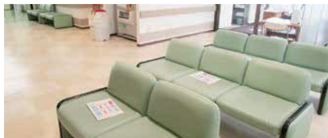
二日市那珂川病院 待合室