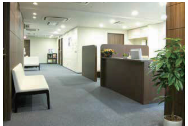
那珂川病院 健診センター