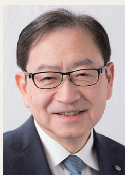
社会医療法人喜悦会 理事長