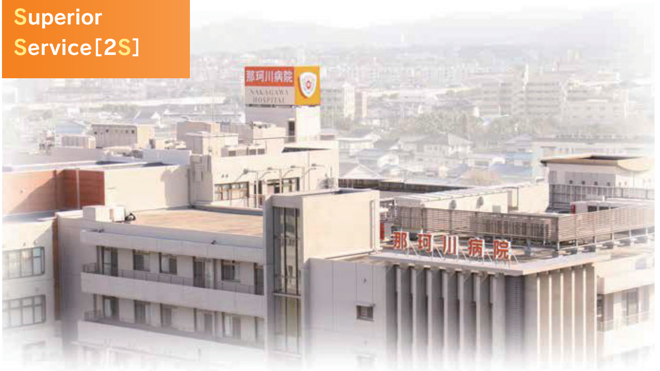
社会医療法人喜悦会 那珂川病院 (162床)