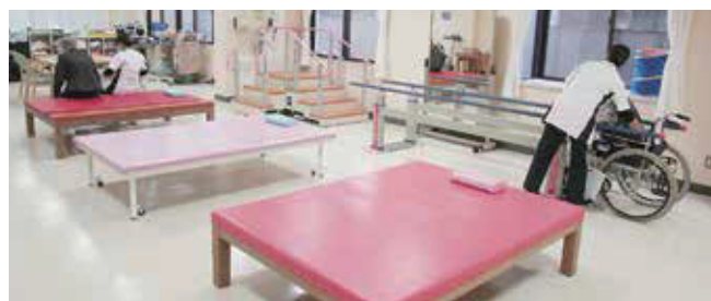
二日市那珂川病院 リハビリ室