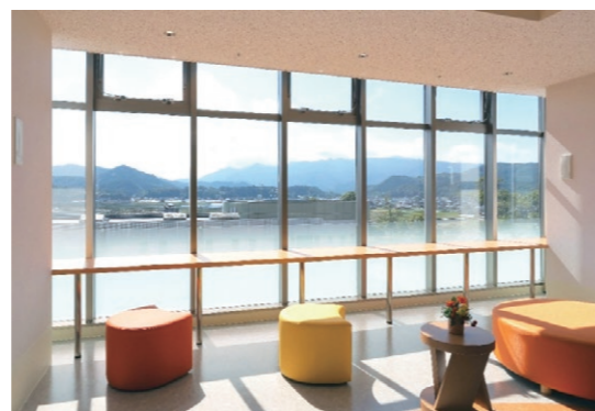
4階ダイルームからの眺望